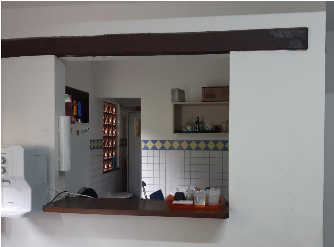
Imagem 03 - Vão do balcão a ser fechado com Drywall- 135cmx101cm (comprimento x altura)

Imagem 03: Copa do São Sebastião PREV com visão do vão de porta a ser fechado com Drywall.