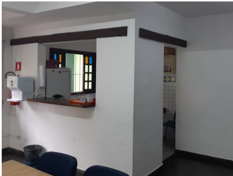
Imagem 01: Copa do São Sebastião PREV com visão do vão do balcão e do vão de porta a serem fechados com Drywall.

3.4. O local dos serviços deverá ser mantido limpo e ao final dos serviços o mesmo deverá ser entregue tendo todos os resíduos recolhidos e descartados de forma que não restem resíduos ou entulho no local, assim como restos de placas de drywal, madeira ou outros.