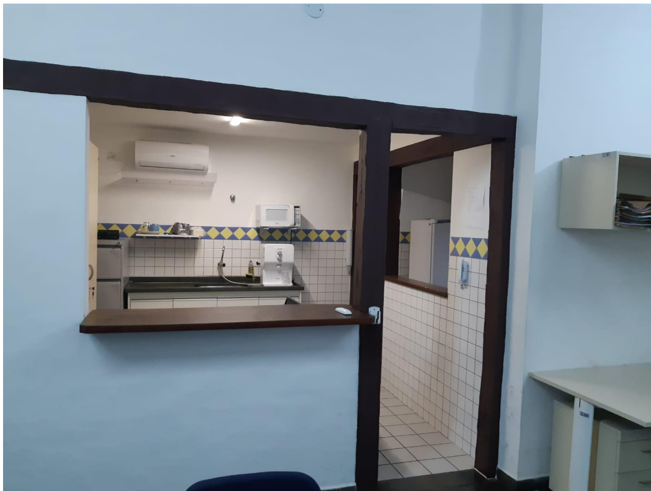
Figura 2 Balcões e porta da cozinha pavimento superior