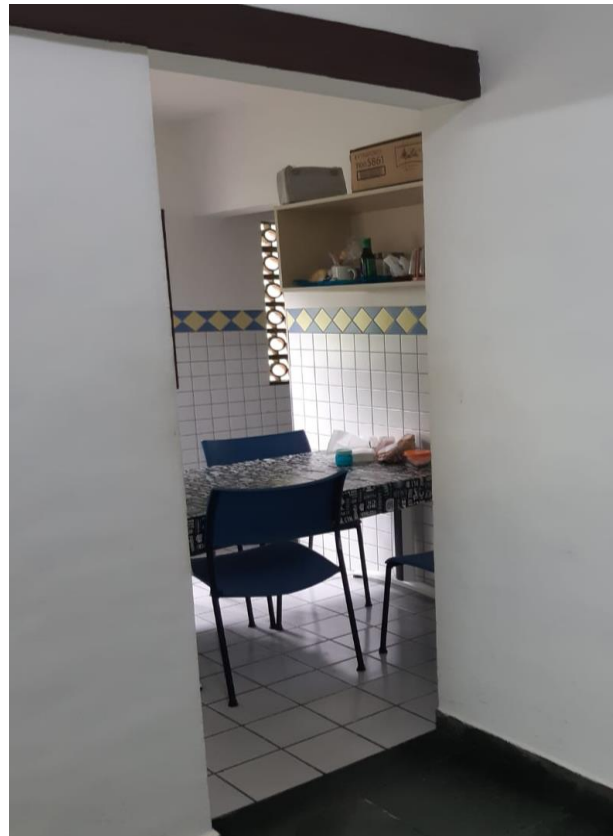
Figura 2- Vão/porta da copa a ser fechado com Drywall – 213cmx78,5cm

Imagem 02: Copa do São Sebastião PREV com visão do vão de porta a ser fechado com Drywall.