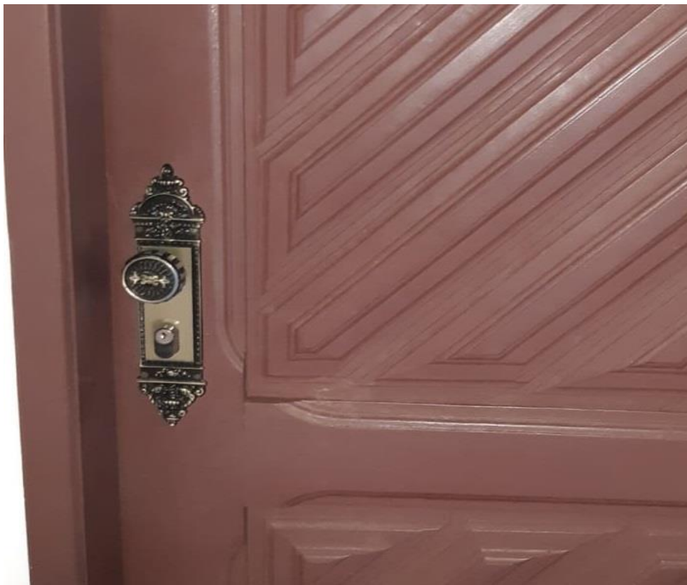
Imagem 01 - Modelo de fechadura das Portas do São Sebastião PREV

Imagem 06: Visão externa do local de instalação da porta completa para novo acesso externo a copa do São Sebastião PREV