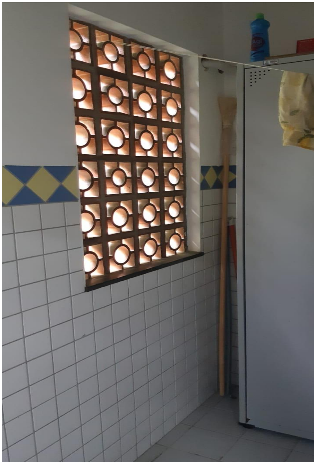
Imagem 04 - Lado interno onde será instalada a porta para novo acesso a copa

Imagem 04: Visão interna do local de instalação da porta completa para novo acesso externo a copa do São Sebastião PREV